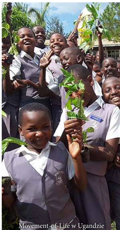
Movement-of-Life w Ugandzie