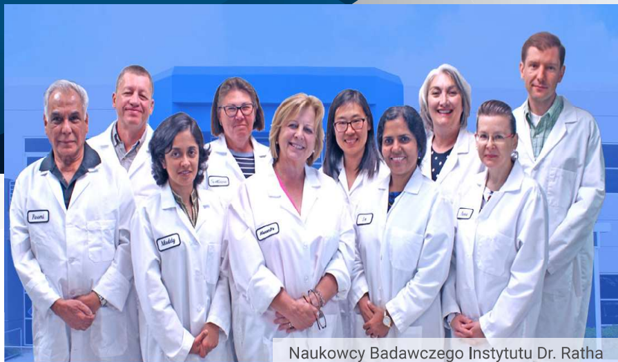
Naukowcy Badawczego Instytutu Dr. Ratha